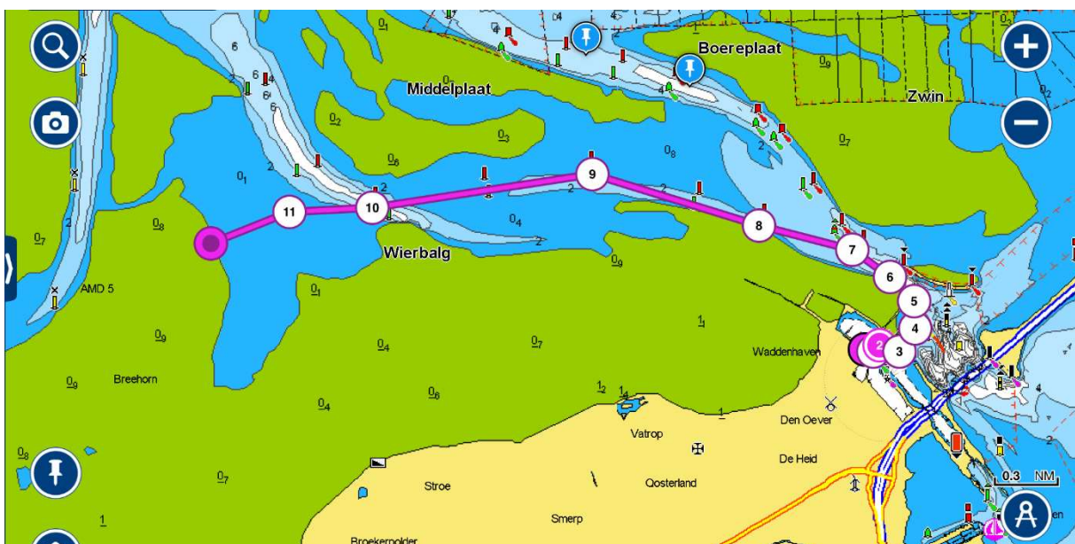
Droogvallen vanuit Den Oever